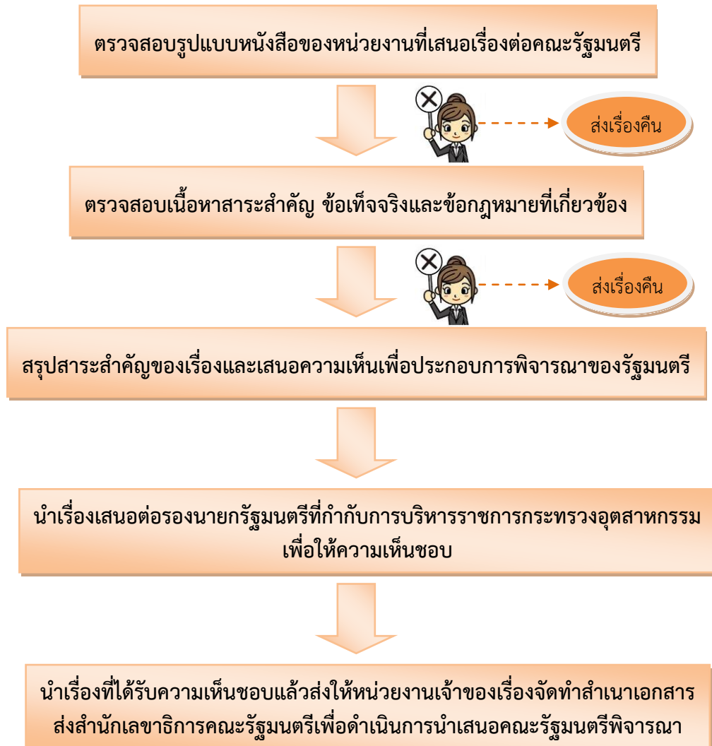
ภาพที่ ๑ แผนผังแสดงขั้นตอนดำเนินการตรวจสอบการขออนุมัติผ่อนผันการใช้พื้นที่ลุ่มน้ำเพื่อทำเหมืองแร่ต่อคณะรัฐมนตรี

การกลั่นกรองเรื่องเสนอคณะรัฐมนตรี กรณีการขออนุมัติผ่อนผันการใช้พื้นที่ลุ่มน้ำเพื่อทำเหมืองแร่ต่อคณะรัฐมนตรี มีหลักเกณฑ์ ขั้นตอน และ วิธีการ ดังนี้