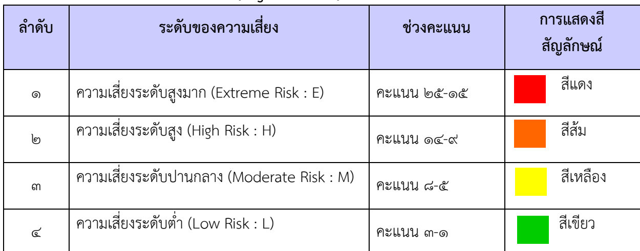
ตารางที่ ๓ แสดงระดับของความเสี่ยง (Degree of Risk)